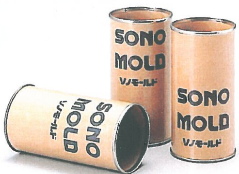
ソノモールド・ミニ (50φ X 100H)