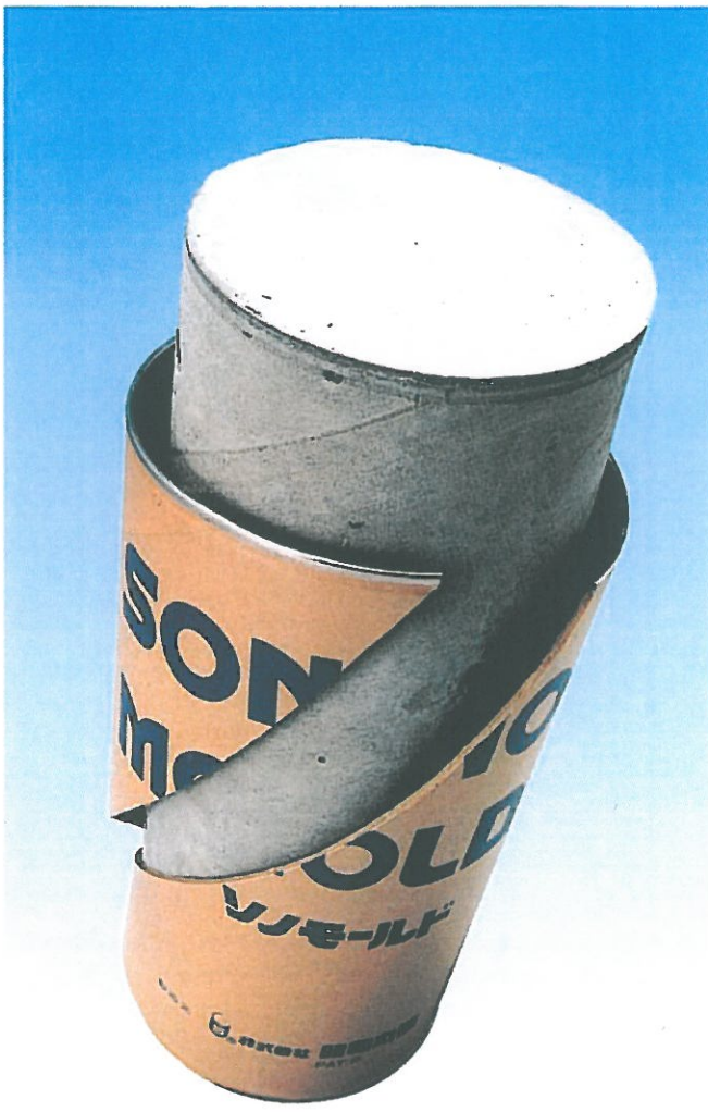
ソノモールド (100φ X 200H) PAT