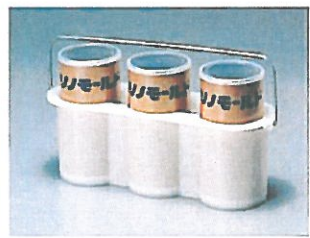
*キャリア (3本入り) は別売りです。 (100φ X 200H用のみ)

本製品には、ソノモールド(100φX200H)とソノモールド・ミニ(50φX100H)があります。用途により、お使い分けて下さい。